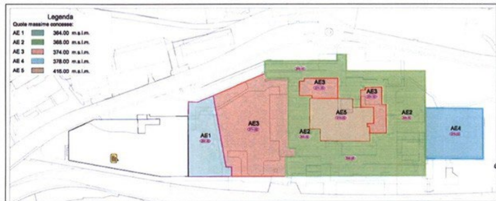
Figura 2. Ingombri planovolumetrici concessi

L'area può essere edificata - con contenuti collegati all'attività dell'Ospedale e del Cardiocentro - nel rispetto degli ingombri planovolumetrici indicati nella planimetria sottostante.