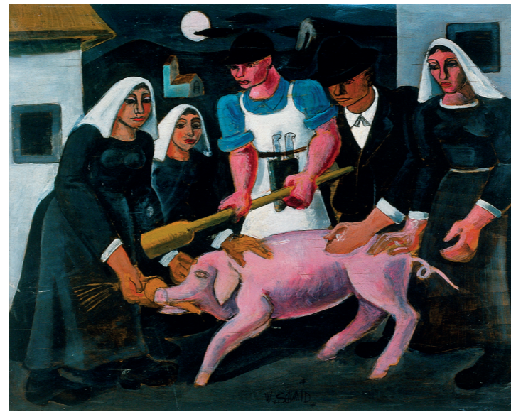
La mazza 1940 circa olio su tavola 49,5 x 63,5 cm

The Museo Schmid, in Brè sopra Lugano, is located in the house where the artist from Canton Aargau, Wilhelm Schmid (1892-1971) once lived. Following the bequest of his wife Maria, in 1973 the house was donated to the City of Lugano, including all the works and documents present there (with the exception of a small number of pieces transferred to the Swiss Confederation and to the Museum of Aargau), with the aim of turning the house into an exhibition and study centre. Since 1983, after restoration work, the building has indeed been open as a small museum, which enriches the Lugano cultural offer and which preserves, in addition to the artist's works, a rich library.