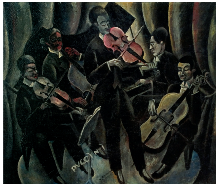
Puccini Butterfly 1917-1918 olio su tela su tavola 84.4 x 100 cm