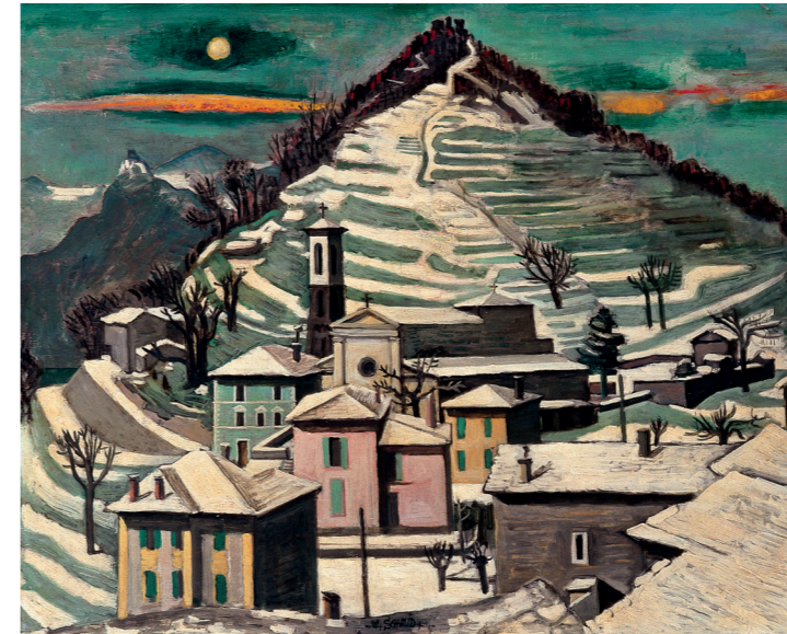
Brè sotto la neve 1945 circa olio su tela 79 x 100 cm