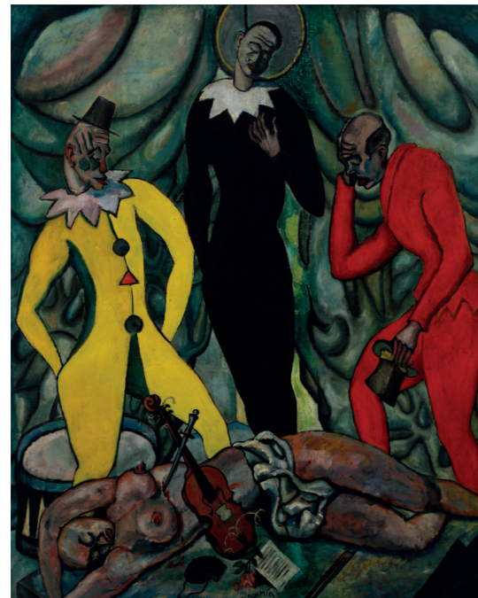
Pierrot impiccato 1918-1920 olio su tela 165 x 140 cm