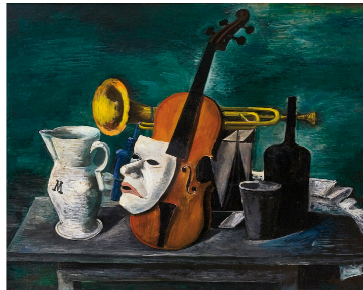
Natura morta con maschera 1930 circa olio su tela 75 x 100 cm