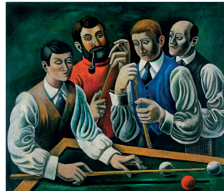
Giocatori di biliardo 1929-1930 olio su tavola 84 x 98 cm